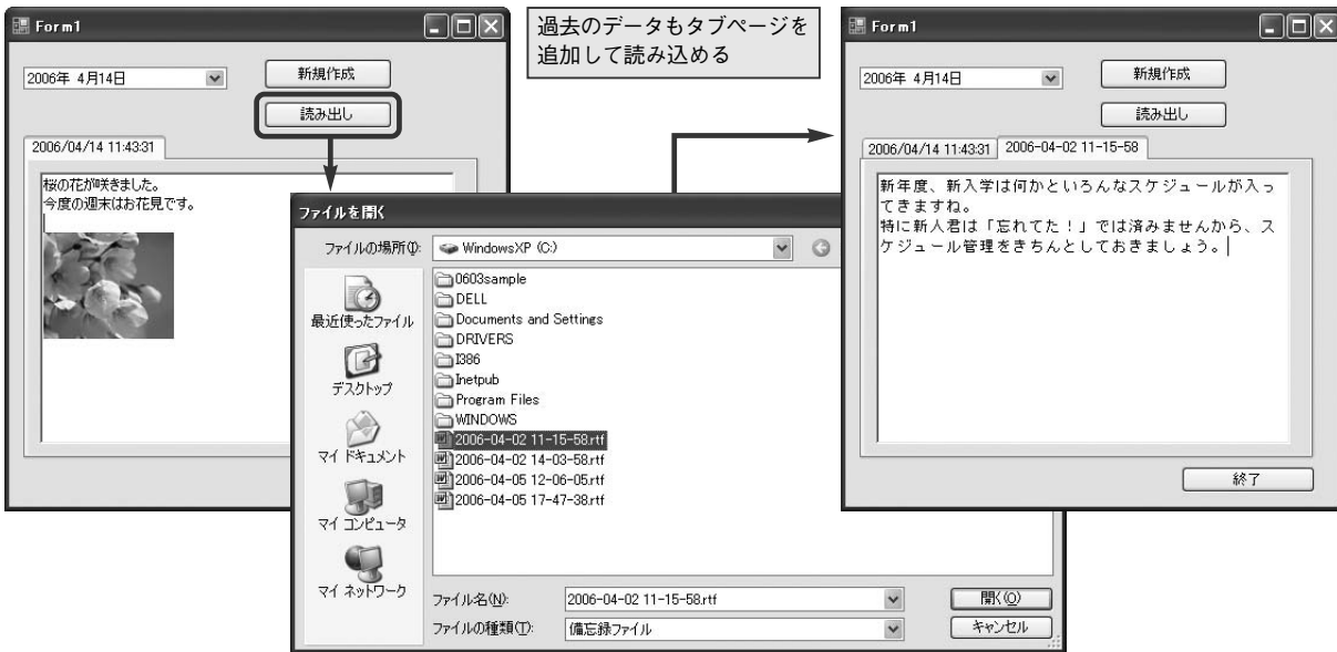
図2：[読み出し] ボタンの処理