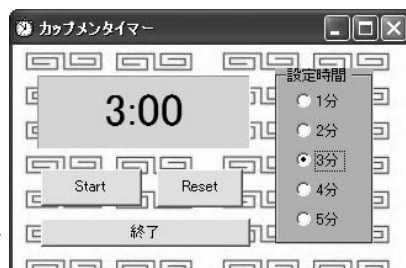
図2: 設定し た時間にな ると、ビーブ 音が鳴りボタ ンが点滅する

図1: 時間を 選んで [Start] ボタンを押す と、カウント ダウンを開始 する