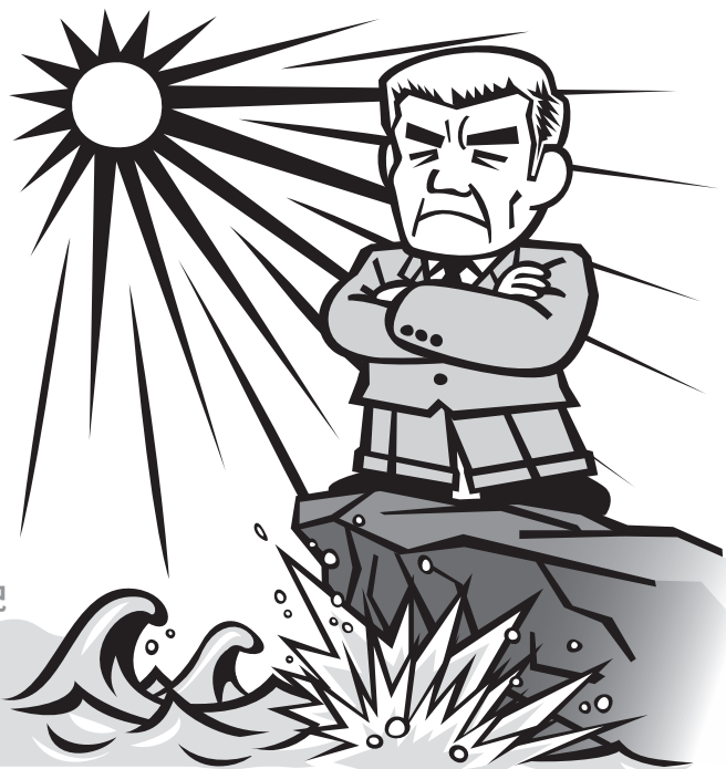
Illustration : Toshiyuki Ido