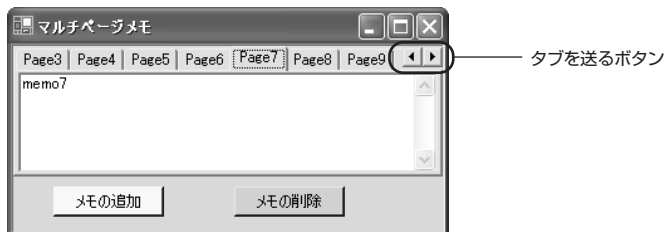
図2：タブ送り用のボタンが自動で追加

次に、フォームにTabControlコントロールを配置し、Dockプロパティを使ってフォームと一体化させます。こ