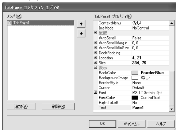
図3：TabPageコレクションエディタ

TabControlコントロールのTabPagesプロパティは、TabPagesコレクションへの参照を返すプロパティで、プロパティウィンドウでTabPages欄の[...]を押すと表示される「TabPageコレクションエディタ」を利用してTabPagesコレクションにTabPageオブジェクトを追加することができます。ここでは、TabPagesコレクション