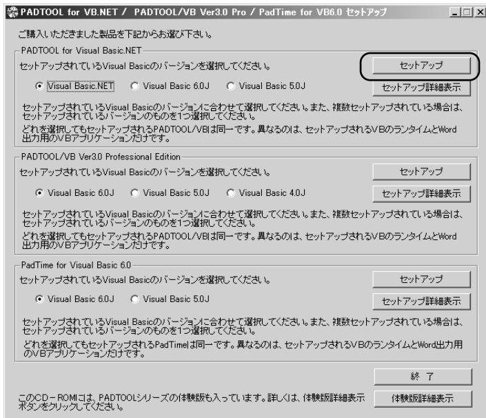
図2: PADTOOL/.NETのセットアッププログラム